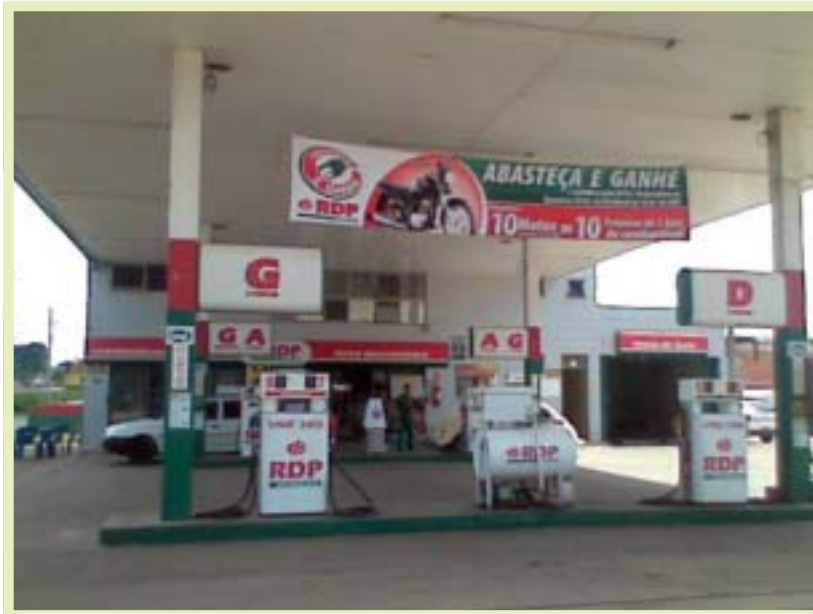
Auto Posto Mediterrâneo em Enseada - SC

Neste Concurso, a distribuidora, em parceria