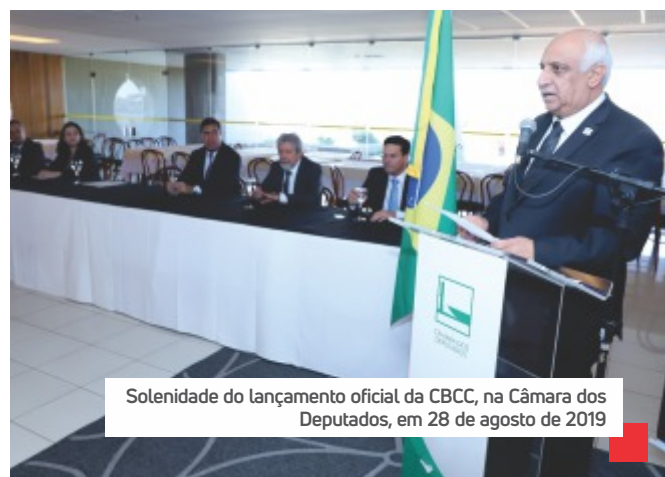
Solenidade do lançamento oficial da CBCC, na Câmara dos Deputados, em 28 de agosto de 2019

Sobre o fim do monopólio no refino de combustíveis com a privatização das refinarias, ele disse que não há discordância, desde que seja respeitada a igualdade de preços da forma como acontece hoje para que não se condene as distribuidoras regionais a saírem do mercado. “É preciso ter regras claras para não desfazer um monopólio público nacional e fabricar um monopólio privado”, concluiu.