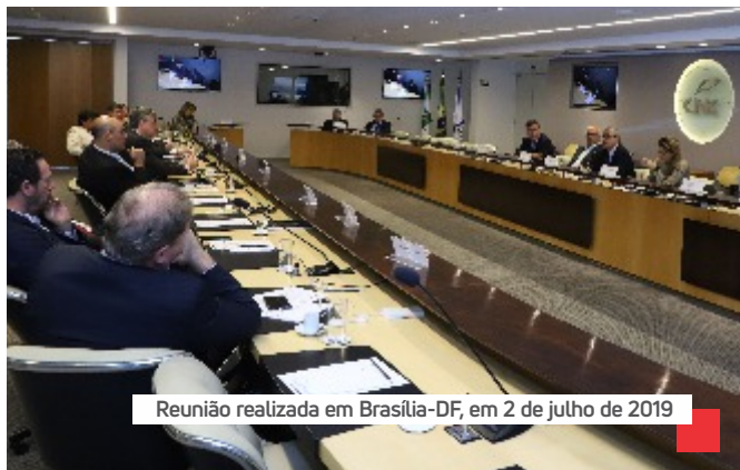
Reunião realizada em Brasília-DF, em 2 de julho de 2019

O segmento de combustíveis e lubrificantes movimenta R$ 267 bilhões em vendas, sendo o terceiro setor mais importante do varejo, em termos de geração de tributo e receita. É também o segundo maior empregador do país, ficando atrás somente de supermercados, segundo dados do IBGE – Instituto Brasileiro de Geografia e Estatística. Essa pujança do setor motivou a CNC – Confederação Nacional do Comércio de Bens, Serviços e Turismo – à criação da CBCC – Câmara Brasileira do Comércio de Combustíveis, instalada em 2 de julho, em Brasília.